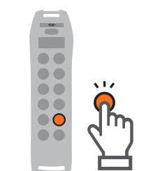
1_ Libérer l'émetteur du pont roulant qui fonctionnera comme Esclave.